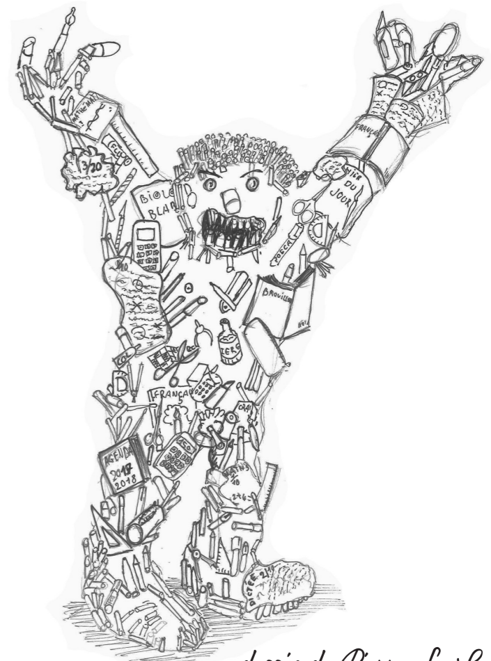
dessin de Pierre Le Saint